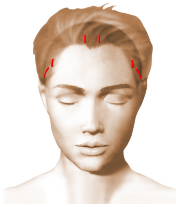
incisions = cicatrices

Chaque chirurgien adopte une technique qui lui est propre et qu'il adapte à chaque cas pour obtenir les meilleurs résultats. Toutefois, on peut retenir des principes de base communs :