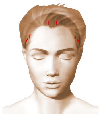
incisions = cicatrices

Chaque chirurgien adopte une technique qui lui est propre et qu'il adapte à chaque cas pour obtenir les meilleurs résultats. Toutefois, on peut retenir des principes de base communs :